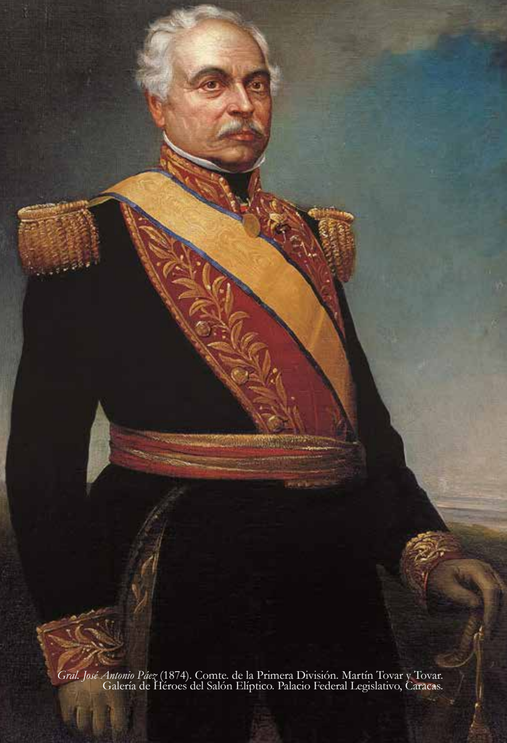
Genl. José Antonio Páez (1874). Comte. de la Primera División. Martín Tovar y Tovar. Galería de Héroes del Salón Elíptico. Palacio Federal Legislativo, Caracas.