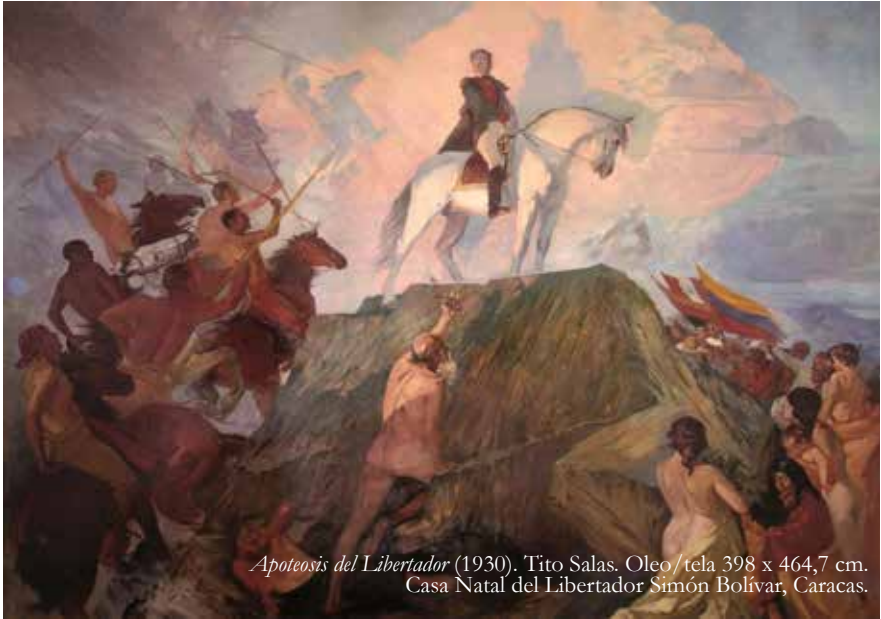
Apoteosis del Libertador (1930). Tito Salas. Oleo/tela 398 x 464,7 cm. Casa Natal del Libertador Simón Bolívar, Caracas.