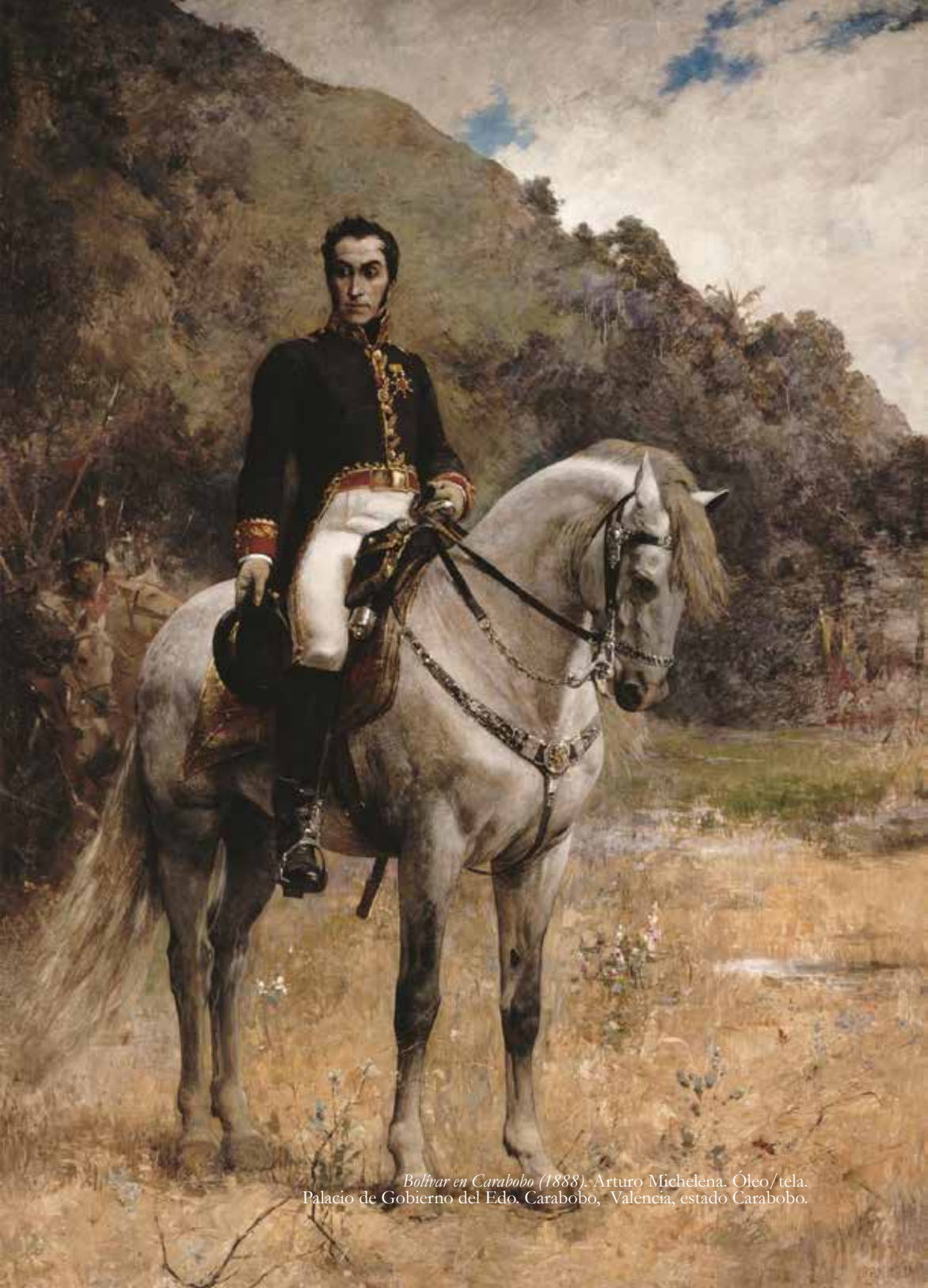
Bolívar en Carabobo (1888) . Arturo Michelena. Óleo/tela. Palacio de Gobierno del Edo. Carabobo, Valencia, estado Carabobo.