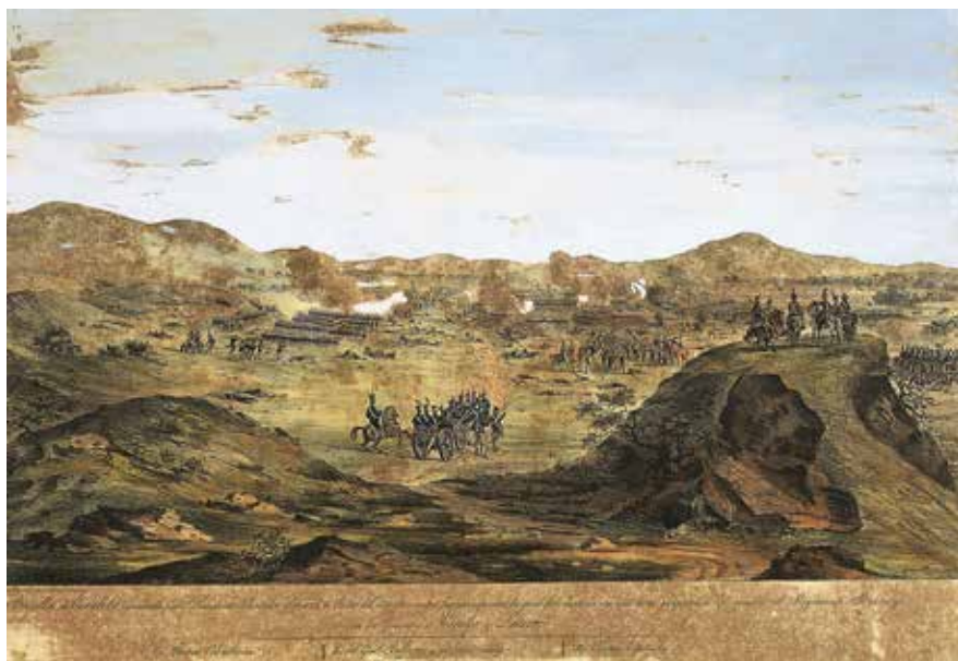
Batalla de Carabobo mandada por el presidente Libertador (Circa, 1821). Ambroise Louis Garneray. Litografía sobre papel. Col. Fundación Museos Nacionales. Galería de Arte Nacional, Caracas.