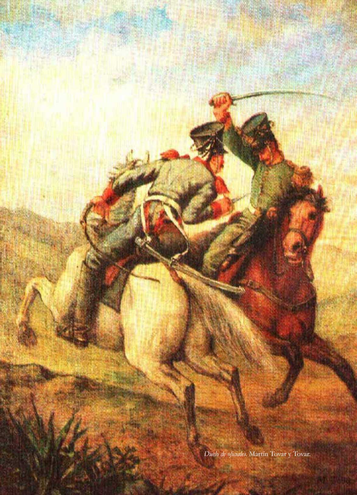
Duelo de oficiales. Martín Tovar y Tovar.