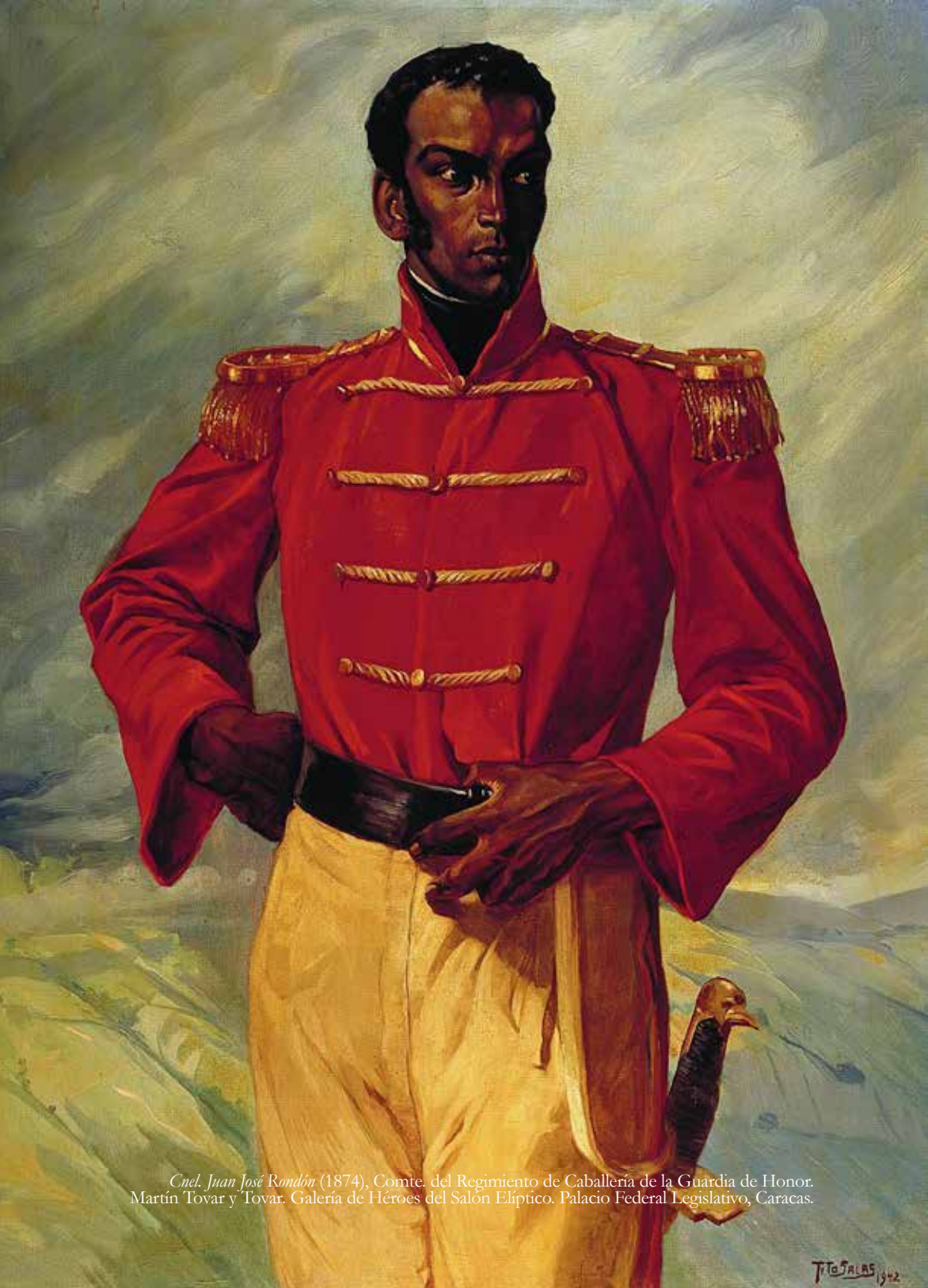
Cnel. Juan José Rondón (1874), Comte. del Regimiento de Caballería de la Guardia de Honor. Martín Tovar y Tovar. Galería de Héroes del Salón Elíptico. Palacio Federal Legislativo, Caracas.