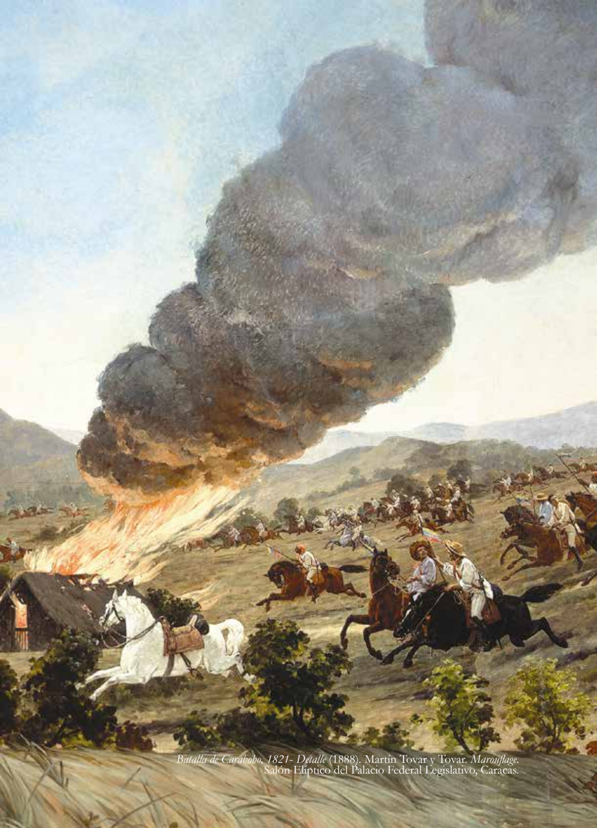
Batalla de Carabobo, 1821- Detalle (1888). Martín Tovar y Tovar. Marouflage. Salón Elíptico del Palacio Federal Legislativo, Caracas.