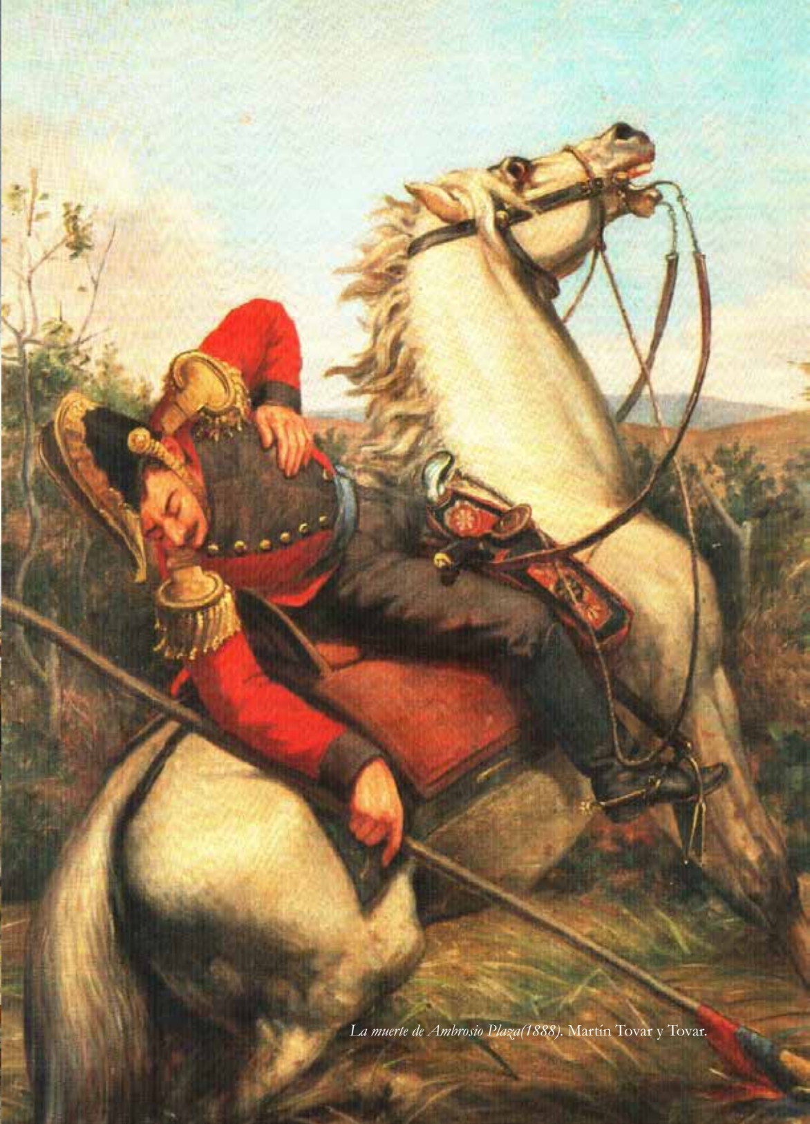
La muerte de Ambrosio Plaza (1888). Martín Tovar y Tovar.