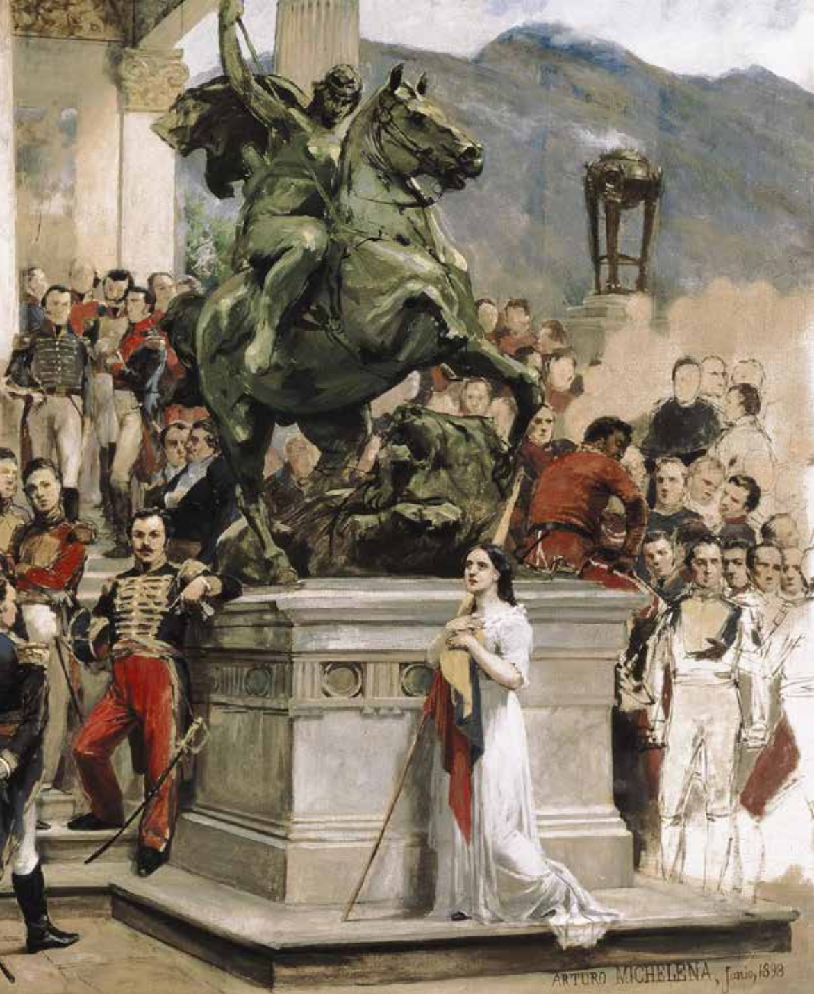
El panteón de los héroes (1898). Arturo Michelena. Óleo/tela. Col. Fundación Cisneros.