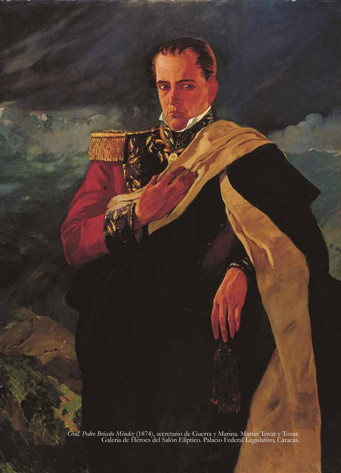
Gral. Pedro Briceño Méndez (1874), secretario de Guerra y Marina. Martín Tovar y Tovar. Galería de Héroes del Salón Elíptico. Palacio Federal Legislativo, Caracas.