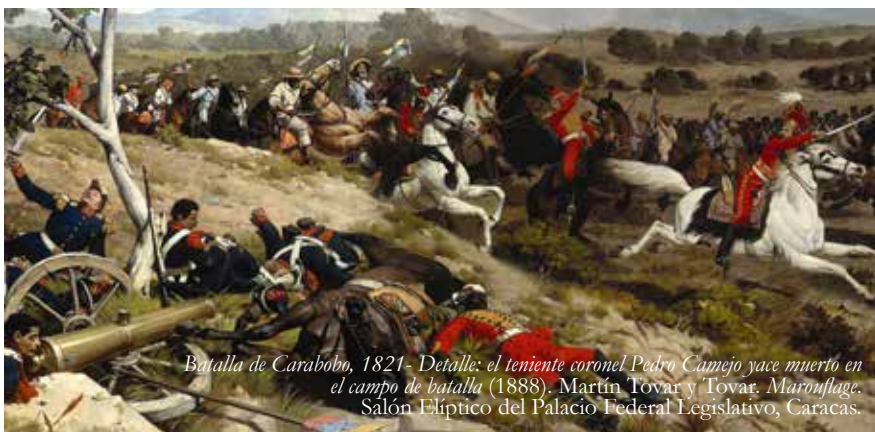
Batalla de Carabobo, 1821 - Detalle: el teniente coronel Pedro Camejo yace muerto en el campo de batalla (1888). Martín Tovar y Tovar. Marouflage. Salón Elíptico del Palacio Federal Legislativo, Caracas.