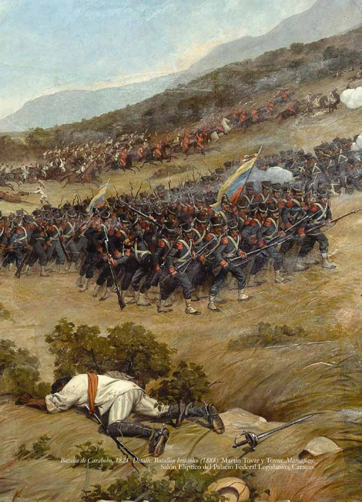
Batalla de Carabobo, 1821- Detalle: Batallón británico (1888). Martín Tovar y Tovar. Marouflage. Salón Elíptico del Palacio Federal Legislativo, Caracas.